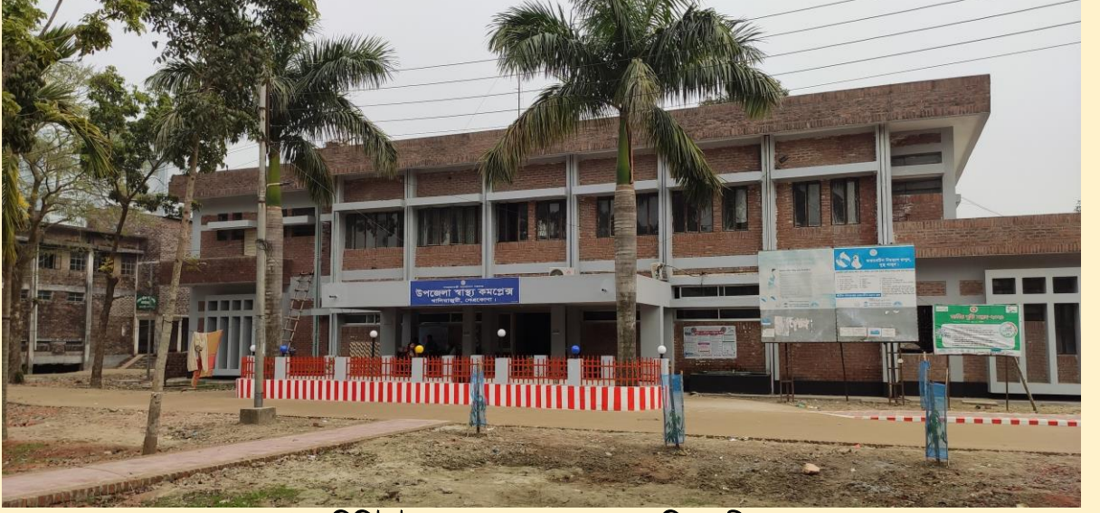
৩১-৫০ শয্যা বিশিষ্ট উপজেলা স্বাস্থ্য কমপ্লেক্স, খালিয়াজুরী, নেত্রকোনা।

(ক) ১০/২০/৩১ শয্যা হতে ৫০ শয্যায় উন্নীতকরণ: সারাদেশে স্বাস্থ্য সেবার মান উন্নয়নের লক্ষ্যে বর্তমান সরকার প্রতিটি উপজেলা স্বাস্থ্য কমপ্লেক্সকে ৫০ শয্যায় উন্নীতকরণের পরিকল্পনা হাতে নিয়েছে। ইতোমধ্যে ৩৭৭টি উপজেলা স্বাস্থ্য কমপ্লেক্সকে ৫০ শয্যায় উন্নীতকরণ কাজ সমাপ্ত হয়েছে। চলমান ৪র্থ স্বাস্থ্য, জনসংখ্যা ও পুষ্টি সেক্টর কর্মসূচী'র ২য় সংশোধিত অপারেশনাল প্লানের আওতায় ৪৫টি উপজেলা স্বাস্থ্য কমপ্লেক্সকে ৫০ শয্যায় উন্নীতকরণ কাজ অন্তর্ভুক্ত রয়েছে। এর মধ্যে গত ২০২১-২২ অর্থ বছরে ০৯টি উপজেলা স্বাস্থ্য কমপ্লেক্সকে ৫০ শয্যায় উন্নীতকরণ কাজ সমাপ্ত করা হয়েছে এবং ১২টি কাজ চলমান রয়েছে।