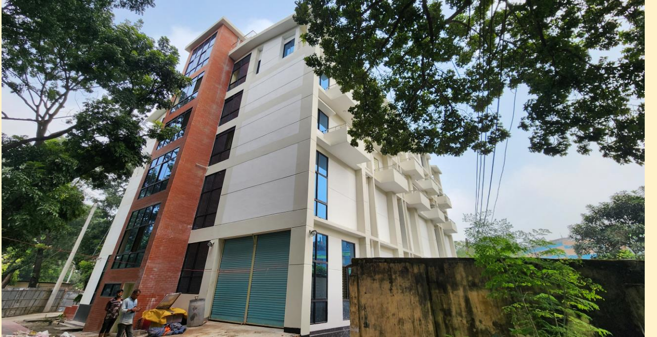
মাল্টিপারপাস ভবন, রংপুর।

(৭) মাল্টিপারপাস ভবন নির্মাণঃ চলমান ৪র্থ স্বাস্থ্য, জনসংখ্যা ও পুষ্টি সেক্টর কর্মসূচী'র ২য় সংশোধিত অপারেশনাল প্লানের আওতায় ১০টি মাল্টিপারপাস ভবন নির্মাণের কাজ অন্তর্ভুক্ত রয়েছে। এর মধ্যে গত ২০২১-২২ অর্থ বছরে ০৫টি মাল্টিপারপাস ভবন নির্মাণের কাজ সমাপ্ত করা হয়েছে এবং ০৫টি মাল্টিপারপাস ভবন নির্মাণের কাজ চলমান আছে।