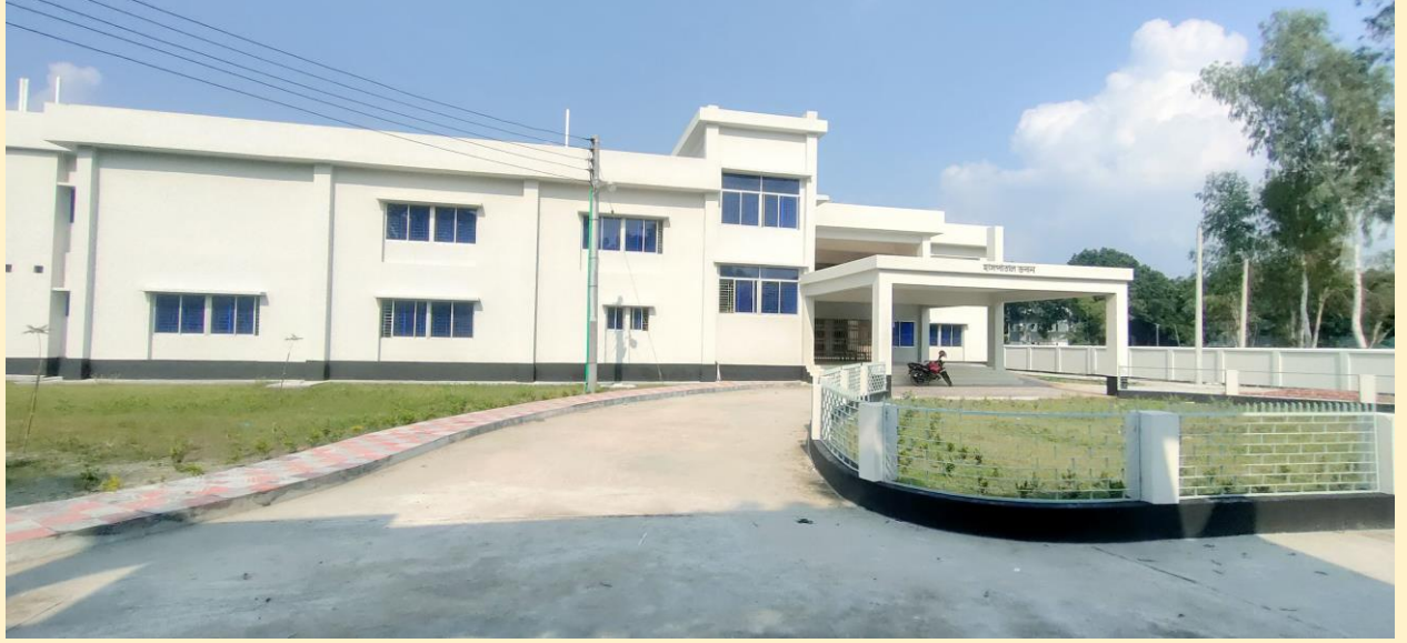
চৌবাড়ী ২০ শয্যা হাসপাতাল, কামারখন্দ, সিরাজগঞ্জ।