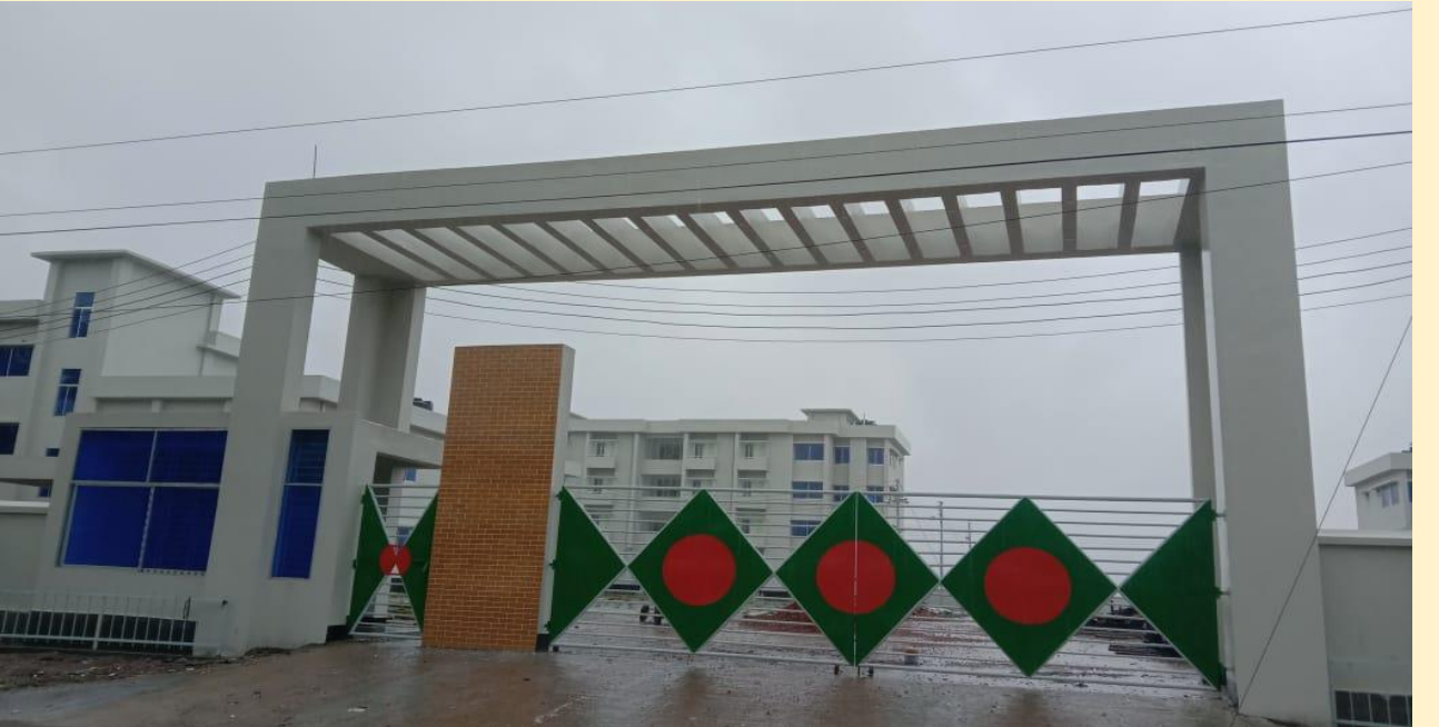
মেডিকেল এ্যাসিস্টেন্ট ট্রেনিং স্কুল (ম্যাটস্), বাহেরচর (বাবুগঞ্জ), বরিশাল।

মান সম্মত স্বাস্থ্য সেবা নিশ্চিত করার জন্য দক্ষ কর্মীর চাহিদা বিবেচনা করে সরকার মেডিকেল এ্যাসিস্টেন্ট ট্রেনিং স্কুল (ম্যাটস্) নির্মাণের পরিকল্পনা করেছে। এ পর্যন্ত ১২টি মেডিকেল এ্যাসিস্টেন্ট ট্রেনিং স্কুল (ম্যাটস্) নির্মাণ কাজ সমাপ্ত করা হয়েছে। চলমান ৪র্থ স্বাস্থ্য, জনসংখ্যা ও পুষ্টি সেক্টর কর্মসূচী'র ২য় সংশোধিত অপারেশনাল প্লানের আওতায় ১৫টি মেডিকেল এ্যাসিস্টেন্ট ট্রেনিং স্কুল (ম্যাটস্) নির্মাণ কাজ অন্তর্ভুক্ত রয়েছে। এর মধ্যে গত ২০২১-২২ অর্থ বছরে ০৩টি মেডিকেল এ্যাসিস্টেন্ট ট্রেনিং স্কুল (ম্যাটস্) নির্মাণ কাজ সমাপ্ত করা হয়েছে এবং সারাদেশে ০৫টি ম্যাটস্ নির্মাণ কাজ চলমান রয়েছে, যার গড় অগ্রগতি ৬১.৮০%।