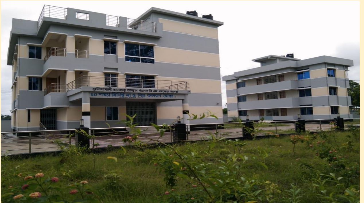
গুলিশাখালী ১০ শয্যা বিশিষ্ট মা ও শিশু কল্যাণ কেন্দ্র, আমতলী, বরগুনা।

উপজেলা স্বাস্থ্য কমপ্লেক্স থেকে দূরবর্তী স্থানে অবস্থিত গুরুত্বপূর্ণ হাট/বাজার/বন্দর ইত্যাদি এলাকায় ১০ শয্যা বিশিষ্ট হাসপাতাল নির্মাণ কার্যক্রম বাস্তবায়িত হচ্ছে। এ সকল কেন্দ্রে প্রাথমিক স্বাস্থ্য সেবাসহ পরিবার পরিকল্পনা সেবা প্রদান করা সম্ভব হবে। এ পর্যন্ত সর্বমোট ১৩৩ টি ১০ শয্যা বিশিষ্ট মা ও শিশু কল্যাণ কেন্দ্র নির্মাণ কাজ সমাপ্ত করা হয়েছে। চলমান ৪র্থ স্বাস্থ্য পুষ্টি ও জনসংখ্যা সেক্টর কর্মসূচী'র ২য় সংশোধিত অপারেশনাল প্লানের আওতায় ৮২টি ১০ শয্যা বিশিষ্ট মা ও শিশু কল্যাণ কেন্দ্র নির্মাণ কাজ অন্তর্ভুক্ত রয়েছে। এর মধ্যে গত ২০২১-২২ অর্থ বছরে ১৪টি ১০ শয্যা বিশিষ্ট মা ও শিশু কল্যাণ কেন্দ্র নির্মাণ কাজ সম্পন্ন হয়েছে এবং বর্তমানে ১৭টি'র নির্মাণ কাজ চলমান রয়েছে, যার গড় অগ্রগতি ৫৮.৮২%।