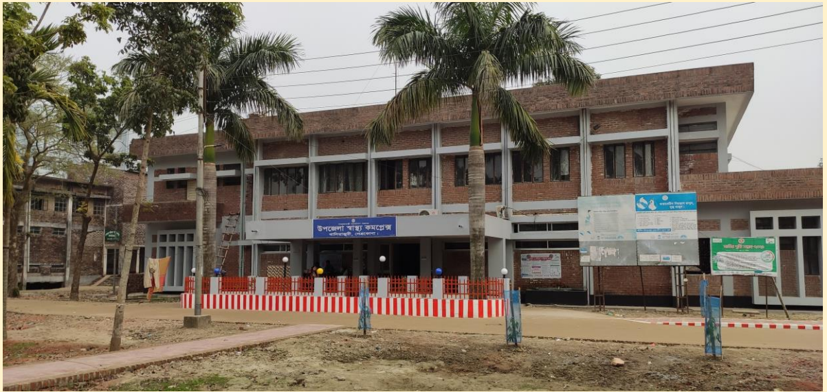
৩১-৫০ শয্যা বিশিষ্ট উপজেলা স্বাস্থ্য কমপ্লেক্স, খালিয়াজুরী, নেত্রকোণা।