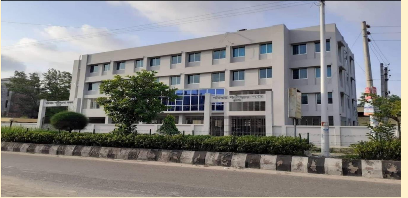
বিভাগীয় পরিচালক পরিবার পরিকল্পনা অফিস ভবন, খুলনা।

(এ৩) উপ-পরিচালকসহ বিভাগীয় পরিচালক পরিবার পরিকল্পনা অফিস নির্মাণ কাজঃ জনসাধারণের পরিবার পরিকল্পনা সেবা নিশ্চিত করার লক্ষ্যে সরকার বিভাগীয় শহরে বিভাগীয় পরিচালক পরিবার পরিকল্পনা অফিস নির্মাণ কার্যক্রম হাতে নিয়েছে। একই ভবনে বিভাগীয় জেলা সদরের উপ-পরিচালক পরিবার পরিকল্পনা অফিসও বিদ্যমান আছে। এ পর্যন্ত ৫টি উপ-পরিচালকসহ বিভাগীয় পরিচালক পরিবার পরিকল্পনা অফিস নির্মাণ কাজ সমাপ্ত করা হয়েছে। চলমান ৪র্থ স্বাস্থ্য, জনসংখ্যা ও পুষ্টি সেক্টর কর্মসূচী'র ২য় সংশোধিত অপারেশনাল প্লানের আওতায় ২টি উপ-পরিচালকসহ বিভাগীয় পরিচালক পরিবার পরিকল্পনা অফিস নির্মাণ কাজ অন্তর্ভুক্ত রয়েছে। এর মধ্যে গত ২০১৯-২০ অর্থ বছরে ১টি বিভাগীয় শহরে উপ-পরিচালকসহ বিভাগীয় পরিচালক পরিবার পরিকল্পনা অফিস নির্মাণ কাজ সমাপ্ত হয়েছে।