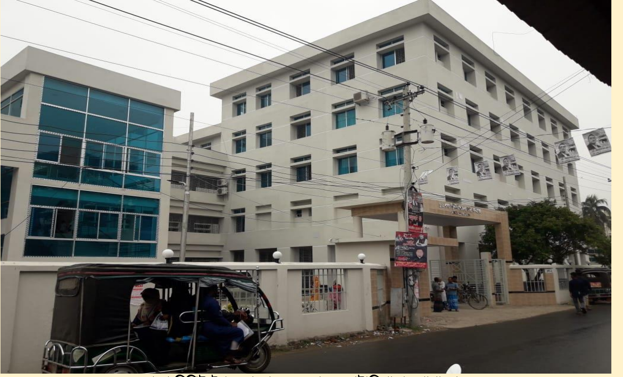
১০০ শয্যা বিশিষ্ট উপজেলা স্বাস্থ্য কমপ্লেক্স, কোটালিপাড়া, গোপালগঞ্জ।