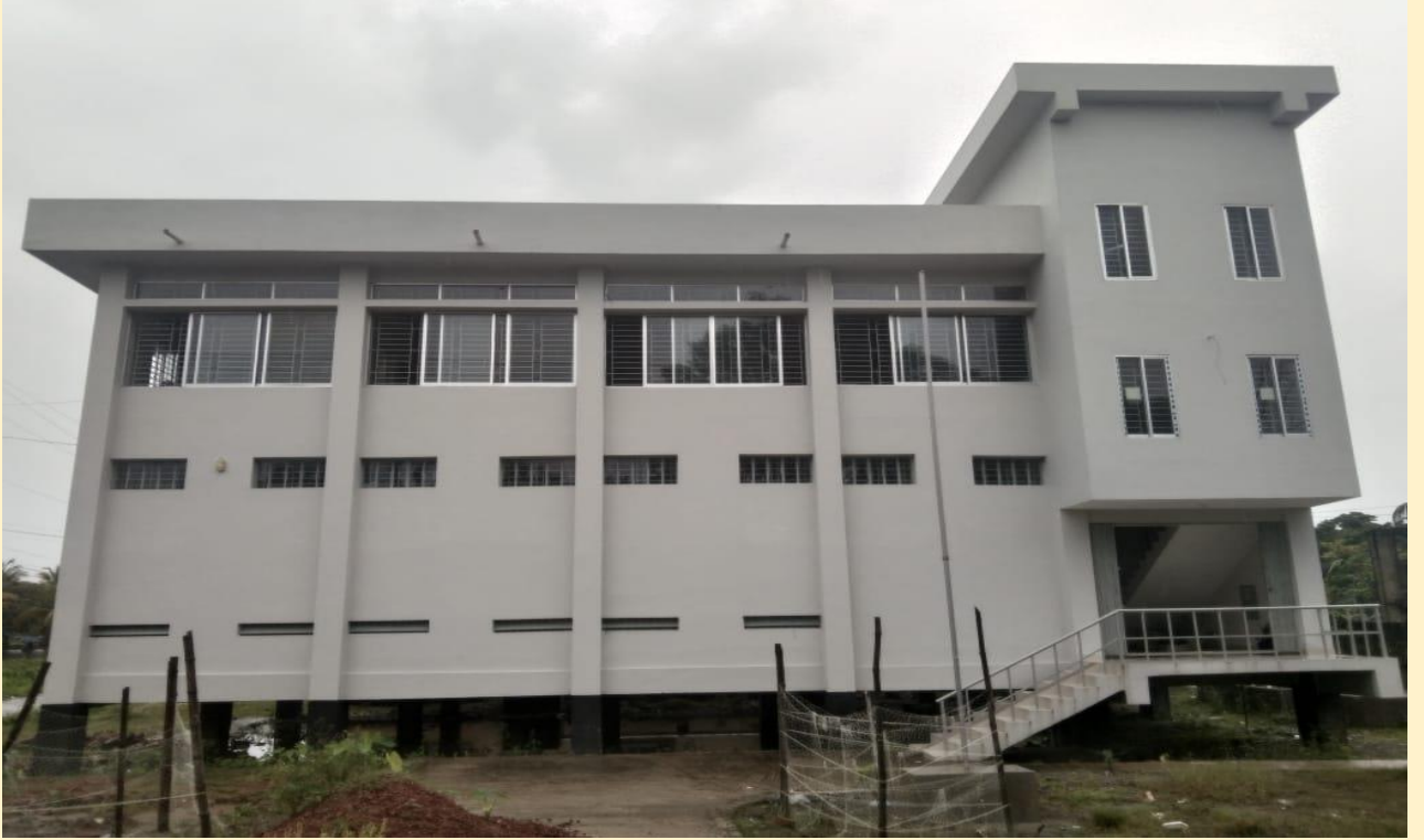
দুমকী উপজেলা পরিবার পরিকল্পনা অফিস কাম-স্টোর, পটুয়াখালী।

পরিবার পরিকল্পনা সামগ্রী এবং ঔষধপত্র সংরক্ষণ এবং দুরবর্তী স্থানে সরবরাহ নিশ্চিত করনের জন্য প্রতিটি উপজেলায় একটি করে উপজেলা পরিবার পরিকল্পনা অফিস কাম-স্টোর নির্মাণ করা হচ্ছে। চলমান ৪র্থ স্বাস্থ্য, জনসংখ্যা ও পুষ্টি সেক্টর কর্মসূচী'র ২য় সংশোধিত অপারেশনাল প্লানের আওতায় ৭৭টি উপজেলা পরিবার পরিকল্পনা অফিস কাম-স্টোর নির্মাণ কাজ অন্তর্ভুক্ত রয়েছে। এর মধ্যে গত ২০২১-২২ অর্থ বছরে ০১টি উপজেলা পরিবার পরিকল্পনা অফিস কাম-স্টোর নির্মাণ কাজ সম্পন্ন হয়েছে।