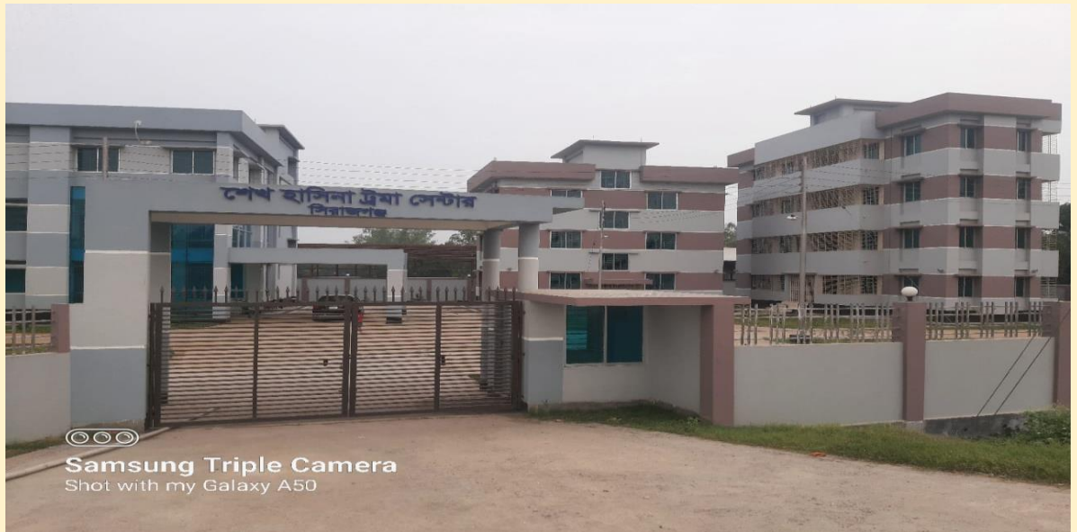
শেখ হাসিনা ট্রমা সেন্টার, সিরাজগঞ্জ