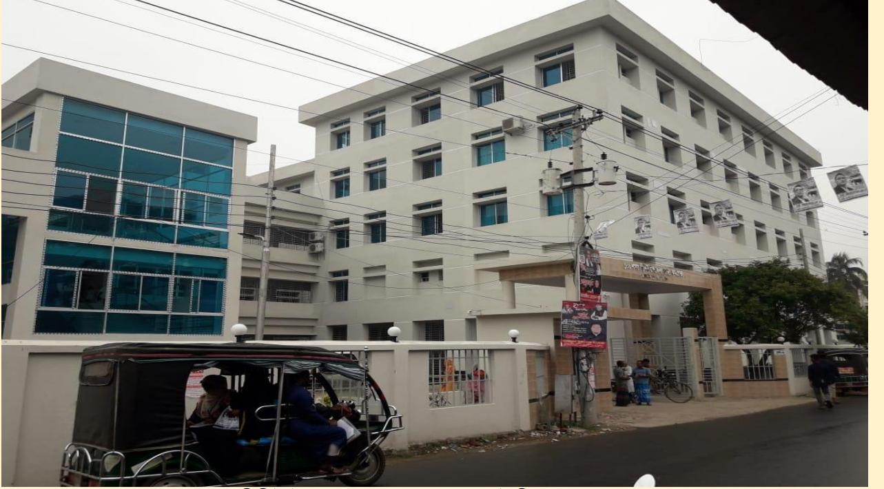
১০০ শয্যা বিশিষ্ট উপজেলা স্বাস্থ্য কমপ্লেক্স, কোটালিপাড়া, গোপালগঞ্জ।

(গ) ৫০ শয্যা হতে ১০০ শয্যায় উন্নীতকরণ: ক্রমবর্ধমান জনসংখ্যার স্বাস্থ্য সেবা নিশ্চিতকরণের লক্ষ্যে চলমান ৪র্থ স্বাস্থ্য, জনসংখ্যা ও পুষ্টি সেক্টর কর্মসূচী'র ২য় সংশোধিত অপারেশনাল প্লানের আওতায় ৩৫টি উপজেলা স্বাস্থ্য কমপ্লেক্সকে ৫০ শয্যা থেকে ১০০ শয্যায় উন্নীতকরণের কাজ অন্তর্ভুক্ত রয়েছে। এর মধ্যে গত ২০২১-২২ অর্থ বছরে ০৫টি উপজেলা স্বাস্থ্য কমপ্লেক্সকে ৫০ শয্যা থেকে ১০০ শয্যায় উন্নীতকরণ কাজ সমাপ্ত করা হয়েছে এবং ০৫টি ৫০ শয্যা থেকে ১০০ শয্যায় উন্নীতকরণ কাজ চলমান রয়েছে।