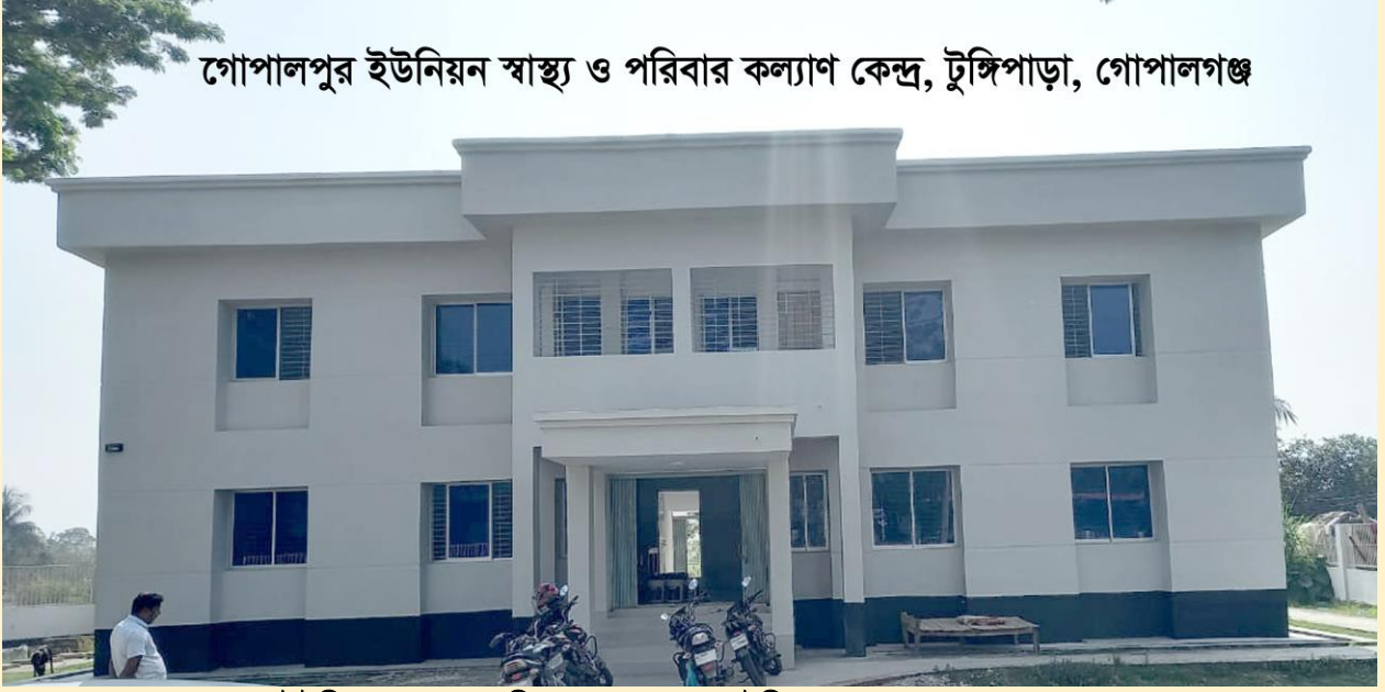
গোপালপুর ইউনিয়ন স্বাস্থ্য ও পরিবার কল্যাণ কেন্দ্র, টুঙ্গিপাড়া, গোপালগঞ্জ।

(গ) ১০ শয্যা বিশিষ্ট মা ও শিশু কল্যাণ কেন্দ্র নির্মাণ কাজঃ