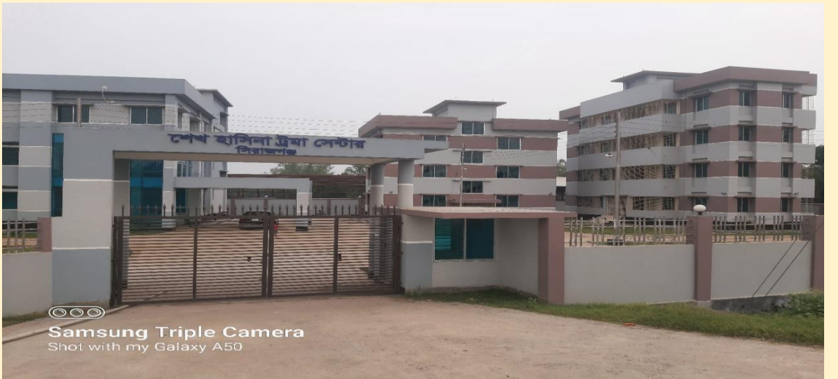
শেখ হাসিনা ট্রমা সেন্টার, সিরাজগঞ্জ।

মহাসড়কের দুর্ঘটনাজনিত রোগীদের স্বাস্থ্য সেবা এবং সংশ্লিষ্ট এলাকার জনগণের অর্থোপেডিক সংক্রান্ত সমস্যার চিকিৎসার লক্ষ্যে সরকার ট্রমা সেন্টার নির্মাণ করার পরিকল্পনা হাতে নিয়েছে। ৩টি ট্রমা সেন্টার নির্মাণ কাজ সমাপ্ত করা হয়েছে। মহাসড়কের দুর্ঘটনাজনিত রোগীদের স্বাস্থ্য সেবা এবং সংশ্লিষ্ট এলাকার জনগণের অর্থোপেডিক সংক্রান্ত সমস্যার চিকিৎসার লক্ষ্যে চলমান ৪র্থ স্বাস্থ্য, জনসংখ্যা ও পুষ্টি সেক্টর কর্মসূচী'র ২য় সংশোধিত অপারেশনাল প্লানের আওতায় ০৬টি ট্রমা সেন্টার নির্মাণ কাজ অন্তর্ভুক্ত রয়েছে এবং ২টি ট্রমা সেন্টার নির্মাণ কাজ চলমান রয়েছে।