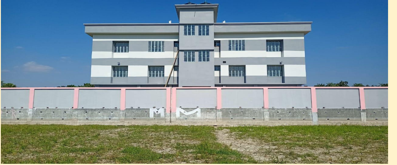
বিলচলন ইউনিয়ন স্বাস্থ্য ও পরিবার কল্যাণ কেন্দ্র, চাটমোহর, পাবনা।

সারাদেশে প্রতিটি ইউনিয়নে ১টি করে ইউনিয়ন স্বাস্থ্য ও পরিবার কল্যাণ কেন্দ্র (UH&FWC) স্থাপন কার্যক্রমের আওতায় ইতোমধ্যে ৪০০৮টি ইউনিয়ন স্বাস্থ্য ও পরিবার কল্যাণ কেন্দ্র নির্মিত হয়েছে। চলমান ৪র্থ স্বাস্থ্য, জনসংখ্যা ও পুষ্টি সেক্টর কর্মসূচী'র ২য় সংশোধিত অপারেশনাল প্লানের আওতায় ১২৪টি ইউনিয়ন স্বাস্থ্য ও পরিবার কল্যাণ কেন্দ্র (UH&FWC) নির্মাণ কাজের পরিকল্পনা করা হয়েছে। এর মধ্যে গত ২০২১-২২ অর্থ বছরে ২৬টি'র নির্মাণ কাজ সমাপ্ত হয়েছে এবং বর্তমানে ১৫টির নির্মাণ কাজ চলমান রয়েছে।