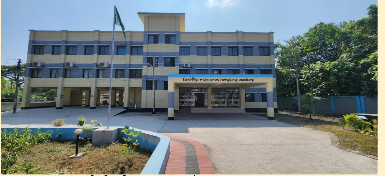
বিভাগীয় পরিচালক (স্বাস্থ্য) এর কার্যালয়, রংপুর।

সিলেট, চট্টগ্রাম এবং রংপুর বিভাগীয় পরিচালক (স্বাস্থ্য)সহ সিভিল সার্জন অফিস নির্মাণ কাজ সমাপ্ত হয়েছে। বরিশাল, পাবনা, কুমিল্লা এবং রাজশাহী এর সিভিল সার্জন অফিস নির্মাণ কাজ ইতোমধ্যে সমাপ্ত হয়েছে। রাজশাহী সিভিল সার্জন অফিস নির্মাণ কাজ চলমান আছে। ঢাকা সিভিল সার্জন অফিস এবং বিভাগীয় পরিচালক (স্বাস্থ্য) খুলনা ও রাজশাহী কার্যালয়ের নির্মাণ কাজ চলমান ৪র্থ স্বাস্থ্য, জনসংখ্যা ও পুষ্টি সেক্টর কর্মসূচী'র ২য় সংশোধিত অপারেশনাল প্লানে অন্তর্ভুক্ত আছে।