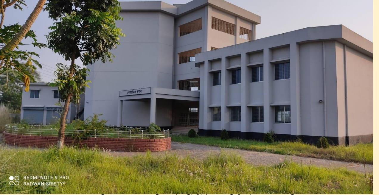
আঞ্চলিক জনসংখ্যা প্রশিক্ষণ ইনস্টিটিউট (আরপিটিআই), সদর, মানিকগঞ্জ।

পরিবার পরিকল্পনা সেবা নিশ্চিত করার লক্ষ্যে দক্ষ কর্মীর চাহিদা বিবেচনা করে সরকার পরিবার পরিকল্পনা প্রশিক্ষণ ইনস্টিটিউট (এফডব্লিউডিআই) যা বর্তমানে আঞ্চলিক জনসংখ্যা প্রশিক্ষণ ইনস্টিটিউট (আরপিটিআই) নামে নামকরণ করা হয়েছে। এ পর্যন্ত সর্বমোট ০৪টি আরপিটিআই নির্মাণ কাজ সমাপ্ত করা হয়েছে। চলমান ৪র্থ স্বাস্থ্য পুষ্টি ও জনসংখ্যা সেক্টর কর্মসূচী'র ২য় সংশোধিত অপারেশনাল প্লানের আওতায় ৬টি আরপিটিআই উন্নীতকরণ কাজ অন্তর্ভুক্ত রয়েছে।