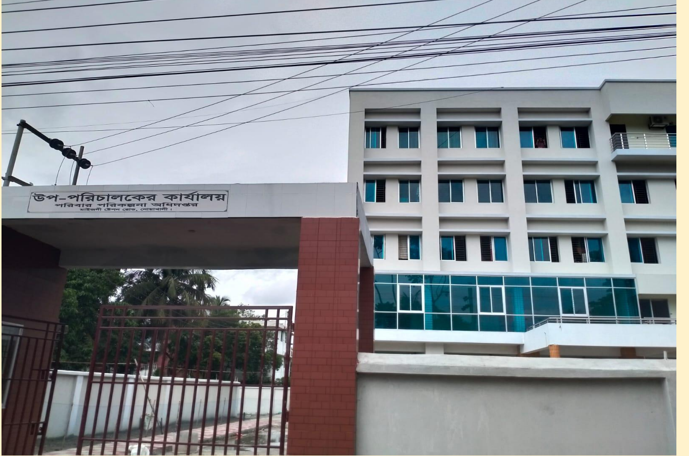
জেলা পরিবার পরিকল্পনা কার্যালয়, সদর, নোয়াখালী।

(ঝ) উপ-পরিচালক পরিবার পরিকল্পনাঃ জনসাধারণের পরিবার পরিকল্পনা সেবা নিশ্চিত করার লক্ষ্যে সরকার জেলা সদরে উপ-পরিচালক পরিবার পরিকল্পনা অফিস নির্মাণ কার্যক্রম হাতে নিয়েছে। এ পর্যন্ত ১৯টি উপ-পরিচালক পরিবার পরিকল্পনা অফিস নির্মাণ কাজ সমাপ্ত করা হয়েছে। চলমান ৪র্থ স্বাস্থ্য, জনসংখ্যা ও পুষ্টি সেক্টর কর্মসূচী'র নার্সিং আওতায় ৩৯টি উপ-পরিচালক পরিবার পরিকল্পনা অফিস নির্মাণ কাজ অন্তর্ভুক্ত রয়েছে। এর মধ্যে গত ২০২১-২২ অর্থ বছরে ০৩টি উপ-পরিচালক পরিবার পরিকল্পনা অফিস নির্মাণ কাজ সমাপ্ত হয়েছে এবং সারাদেশে ১০টি উপ-পরিচালক পরিবার পরিকল্পনা অফিস নির্মাণ কাজ চলমান রয়েছে, যার গড় অগ্রগতি ৩৯.৬০%।