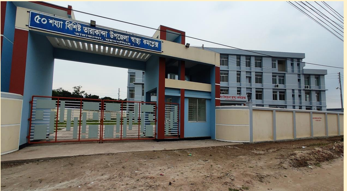
৫০ শয্যা বিশিষ্ট উপজেলা স্বাস্থ্য কমপ্লেক্স, তারাকান্দা, ময়মনসিংহ।

(খ) ৫০ শয্যা বিশিষ্ট নতুন উপজেলা স্বাস্থ্য কমপ্লেক্স নির্মাণ কাজ: বর্তমান সরকার সকল নবসৃষ্ট উপজেলায় নতুন ৫০ শয্যা বিশিষ্ট উপজেলা স্বাস্থ্য কমপ্লেক্স নির্মাণের পরিকল্পনা হাতে নিয়েছে। চলমান ৪র্থ স্বাস্থ্য, জনসংখ্যা ও পুষ্টি সেক্টর কর্মসূচী'র ২য় সংশোধিত অপারেশনাল প্লানের আওতায় ০৮টি ৫০ শয্যা বিশিষ্ট উপজেলা স্বাস্থ্য কমপ্লেক্স নির্মাণ কাজ অন্তর্ভুক্ত আছে যার মধ্যে ৪টির নির্মাণ কাজ সমাপ্ত হয়েছে এবং ০১টি ৫০ শয্যা বিশিষ্ট উপজেলা স্বাস্থ্য কমপ্লেক্স নির্মাণ কাজ চলমান রয়েছে।