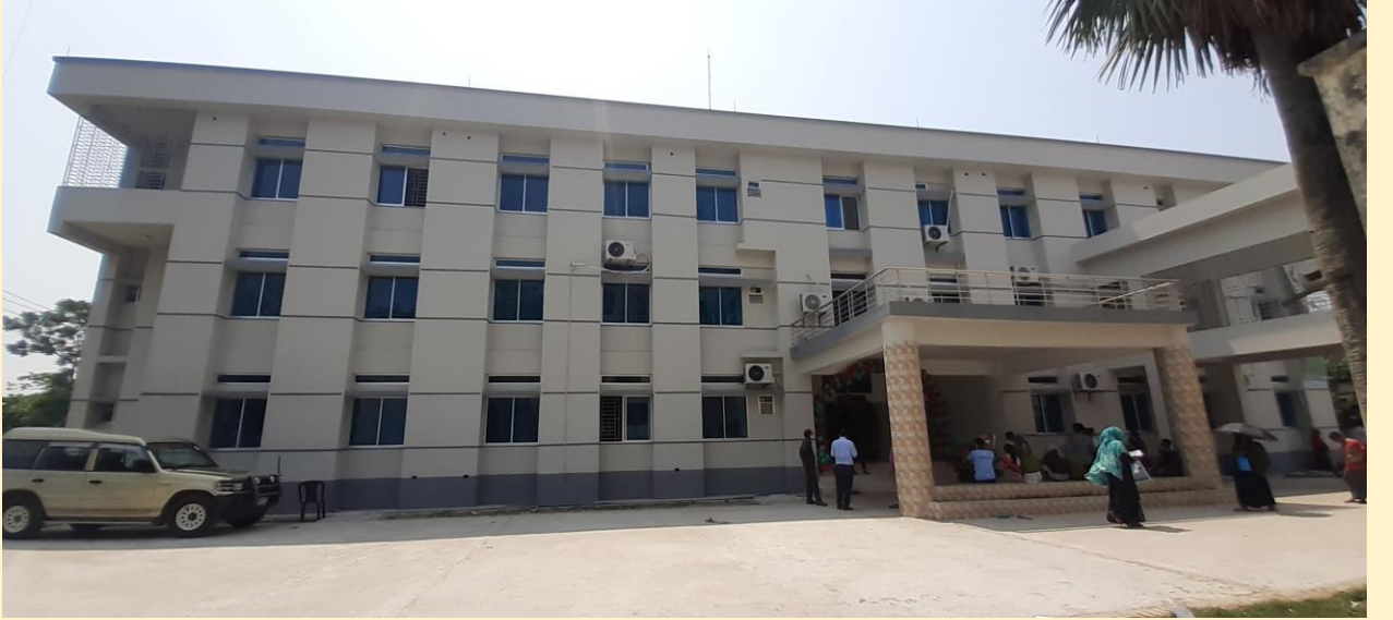
বিদ্যমান পুরাতন উপজেলা স্বাস্থ্য কমপ্লেক্স পুনঃনির্মাণ কাজ রামপাল, বাগেরহাট।