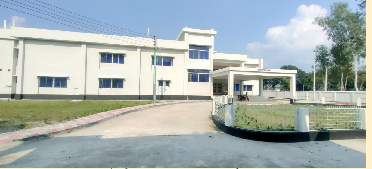
চৌবাড়ী ২০ শয্যা হাসপাতাল, কামারখন্দ, সিরাজগঞ্জ।

জনগণের স্বাস্থ্য সেবার মান উন্নয়নের লক্ষ্যে চলমান ৪র্থ স্বাস্থ্য, জনসংখ্যা ও পুষ্টি সেক্টর কর্মসূচী'র ২য় সংশোধিত অপারেশনাল প্লানের আওতায় ১৪টি ২০ শয্যাবিশিষ্ট হাসপাতাল নির্মাণ কাজ অন্তর্ভুক্ত রয়েছে। এর মধ্যে গত ২০২১-২২ অর্থ বছরে ০১টি সমাপ্ত হয়েছে এবং ৪টি ২০ শয্যা বিশিষ্ট হাসপাতাল নির্মাণের কাজ চলমান রয়েছে।