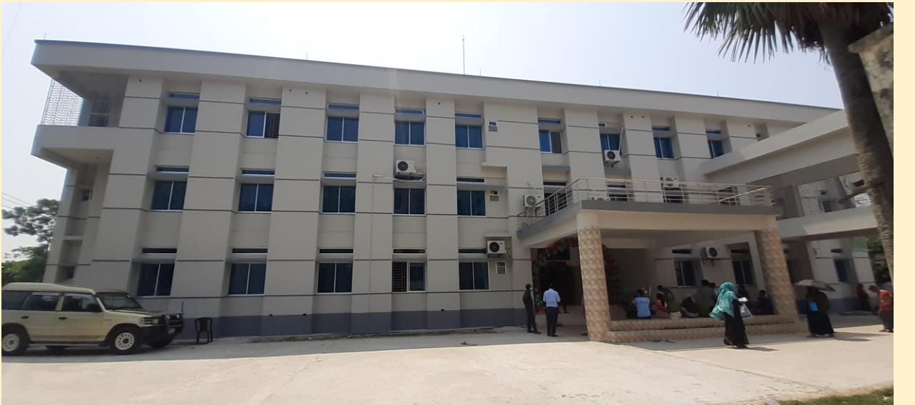
বিদ্যমান পুরাতন উপজেলা স্বাস্থ্য কমপ্লেক্স পুনঃনির্মাণ কাজ রামপাল, বাগেরহাট।

(ঘ) জরাজীর্ণ পুরাতন হাসপাতাল পুনঃনির্মাণ: অতি পুরাতন ব্যবহার অনুপযোগী এবং জরাজীর্ণ হাসপাতালগুলোকে জনসাধারণের স্বাস্থ্য উপযোগী করে গড়ে তোলার পরিকল্পনা বর্তমান সরকার হাতে নিয়েছে। চলমান ৪র্থ স্বাস্থ্য, জনসংখ্যা ও পুষ্টি সেক্টর কর্মসূচী'র ২য় সংশোধিত অপারেশনাল প্লানের আওতায় অতি পুরাতন, জরাজীর্ণ এবং ব্যবহার অনুপযোগী ২৯টি উপজেলা স্বাস্থ্য কমপ্লেক্স পুনঃনির্মাণ কাজ অন্তর্ভুক্ত রয়েছে। এর মধ্যে গত ২০২১-২২ অর্থ বছরে ০৩টি সমাপ্ত হয়েছে এবং ১৫টির পুনঃনির্মাণ কাজ চলমান আছে।